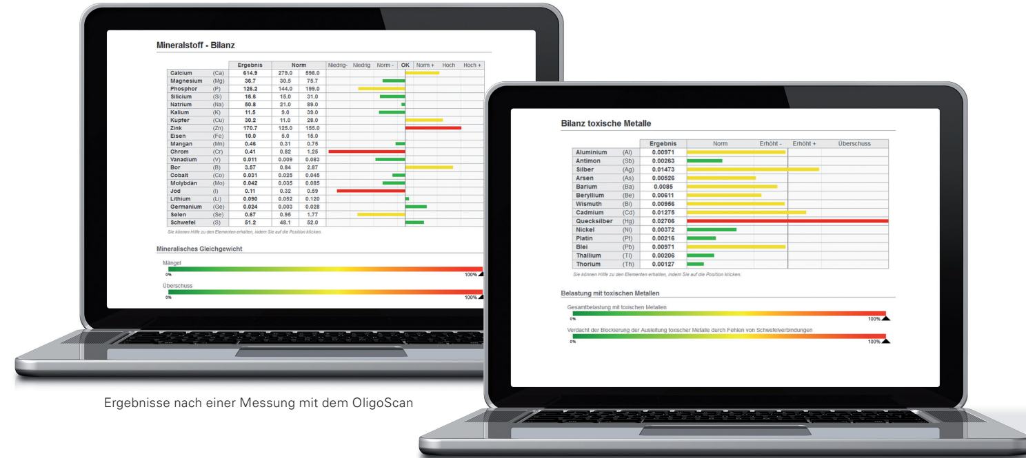
Ergebnisse nach einer Messung mit dem OligoScan

Unter Berücksichtigung mehrerer Gegebenheiten wie Alter, Grösse, Körpergewicht, Geschlecht und Blutgruppe wird gemessen, ob Ihr Gewebe ausgeglichene Konzentrationen der Mineralien und Spurenelemente aufweist. Ein Mangel oder ein Überschuss kann die optimale Zellregulation stören.